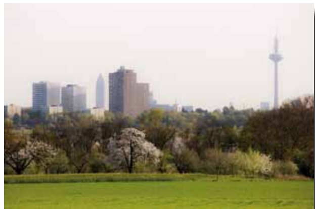
Nur wertloses Ackerland? Oder für den Menschen lebenswichtige Umwelt?

D enn in Frankfurts Innenstadt zeigen sich die Auswirkungen auf das